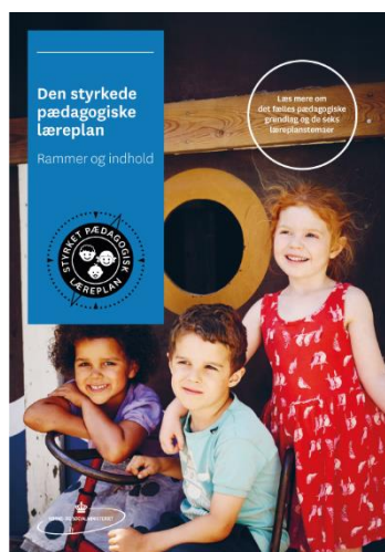
Den styrkede pædagogiske læreplan. Rammer og indhold

Inden for de krav, der følger af dagtilbudsloven, er det op til jer at beslutte, hvordan I konkret vil arbejde med den pædagogiske læreplan. Jeres læreplan skal være et dynamisk og meningsfuldt dokument, som peger fremad, og som I kan bruge aktivt i den løbende udvikling af den pædagogiske kvalitet og jeres pædagogiske praksis.