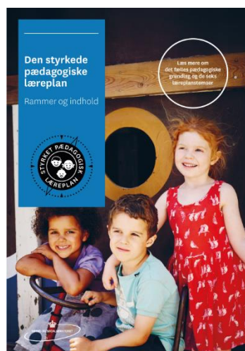
Den styrkede pædagogiske læreplan. Rammer og indhold

Inden for de krav, der følger af dagtilbudsloven, er det op til jer at beslutte, hvordan I konkret vil arbejde med den pædagogiske læreplan. Jeres læreplan skal være et dynamisk og meningsfuldt dokument, som peger fremad, og som I kan bruge aktivt i den løbende udvikling af den pædagogiske kvalitet og jeres pædagogiske praksis.